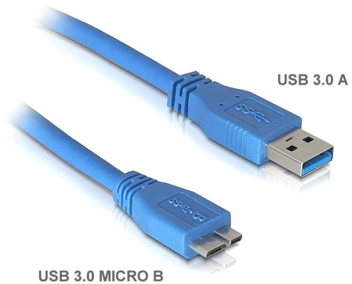
USB 3.0 A