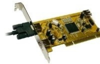
Anwendungsbeispiel example of use exemple d'utilisation