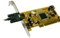
Anwendungsbeispiel example of use exemple d'utilisation