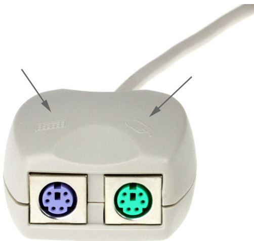
PC 99 Standard (Colors)