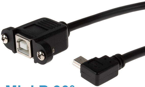
Mini B 90°