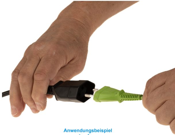
Anwendungsbeispiel example of use exemple d'application