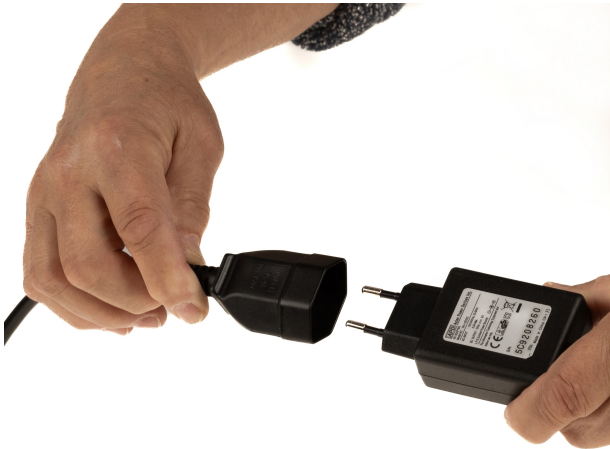
Anwendungsbeispiel example of use exemple d'application