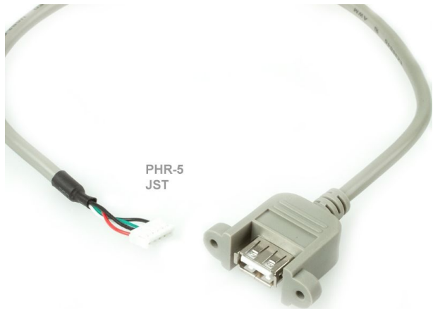
USB 2.0 A female