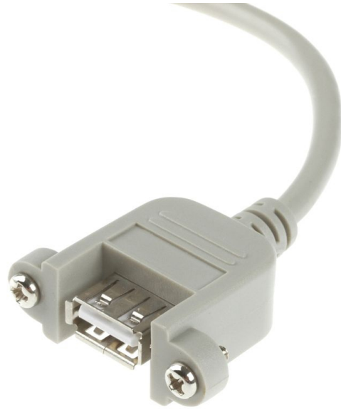
USB 2.0 A Buchse / female / femelle