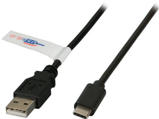
weiß white blanc USB 2.0 A USB Type-C™