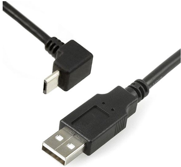
USB 2.0 MICRO B 90°